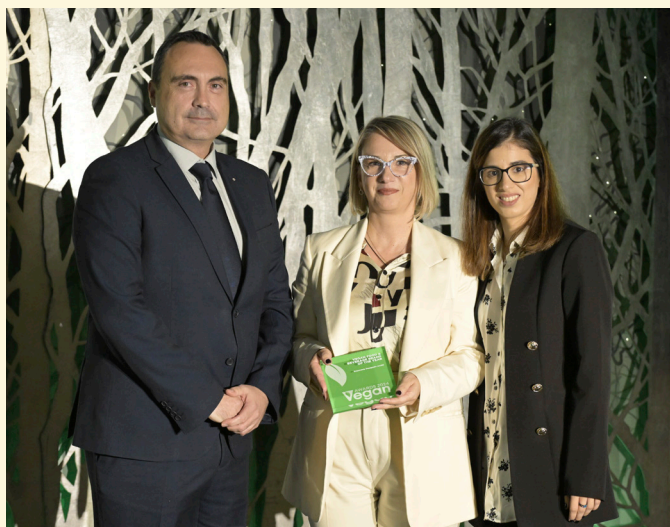
Vegan Brand of the Year - Βιομηχανία Ζυμαρικών Ήλιος