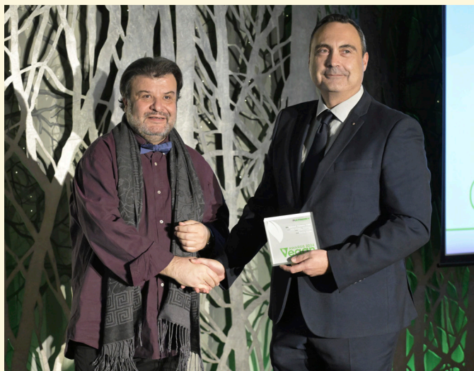
Platinum Winner - Βιομηχανία Ζυμαρικών Ήλιος