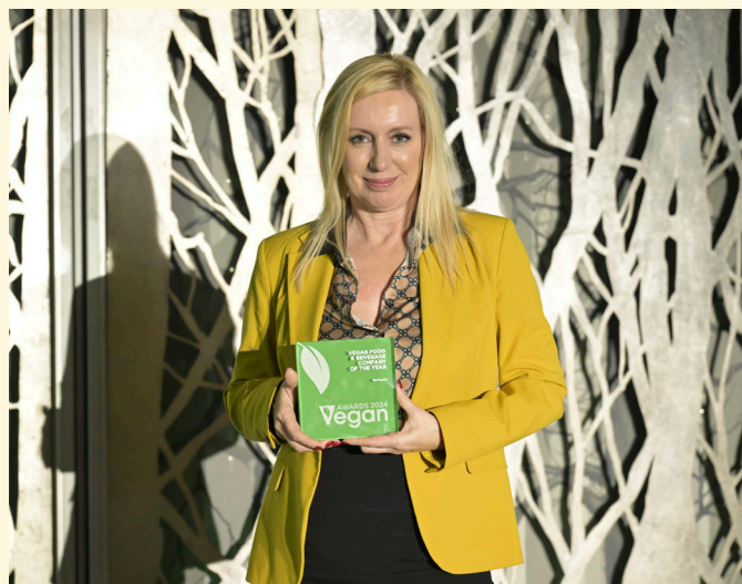
Vegan Company of the Year - ΒιοΑγρός