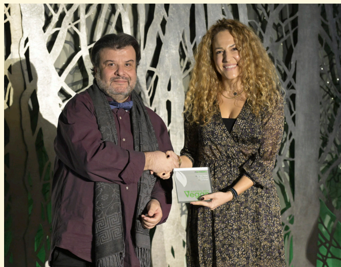
Platinum Winner - The Mighty Kitchen